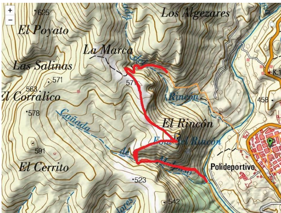
Plano zona militar cerro el rincon y malpaso